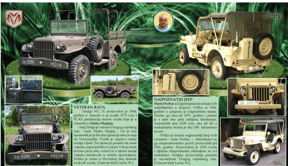
1944 Dodge WC 51